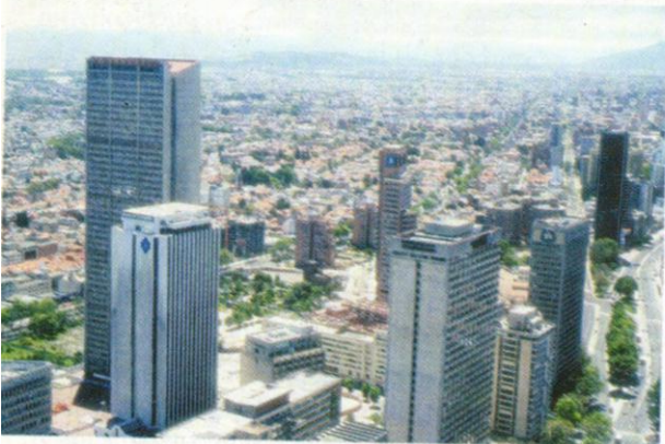
■ El Distrito Capital de Bogotá tiene una asignación de recursos similar a la de los departamentos, debido a su densidad de población y a sus múltiples necesidades.

La Constitución política, en el artículo 346, señala que los presupuestos generales del Estado se realizarán por períodos anuales y deberán ser presentados al Congreso para su discusión y aprobación.