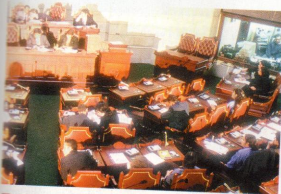
■ Discusión de los presupuestos de la comunidad. ¿Existe equidad en la asignación de los recursos?