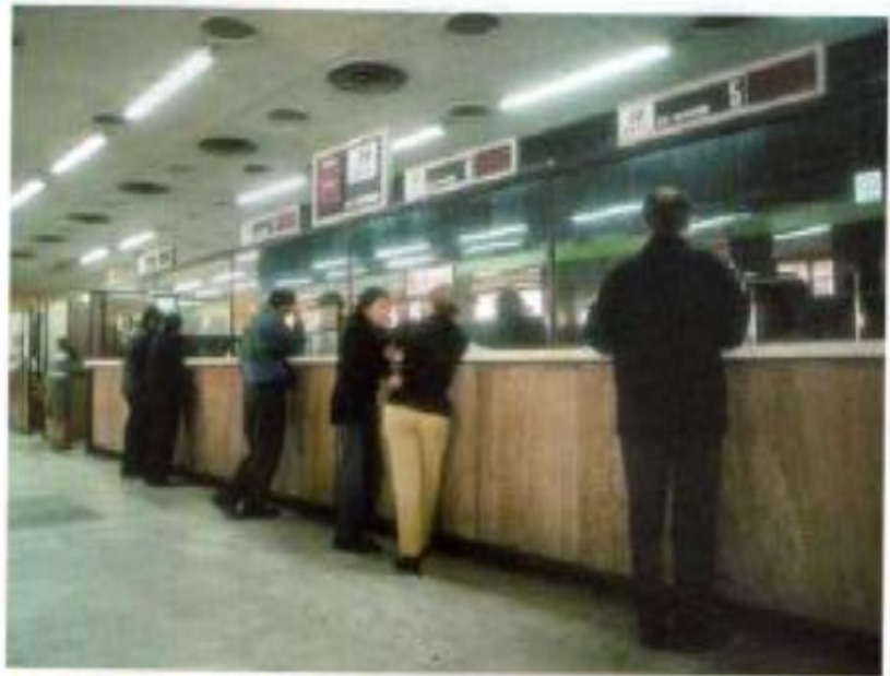
■ La población acepta pagar impuestos si ve en qué se gastan.

Por esta razón, es prioritario aumentar la eficiencia del gasto público, para poder ofrecer más servicios sociales con el nivel actual de recursos. Un ejemplo de ello es el sector educativo, en el que se hace indispensable la adopción de un sistema de financiación por estudiante atendido, con el objeto de transferir más recursos a los agentes públicos